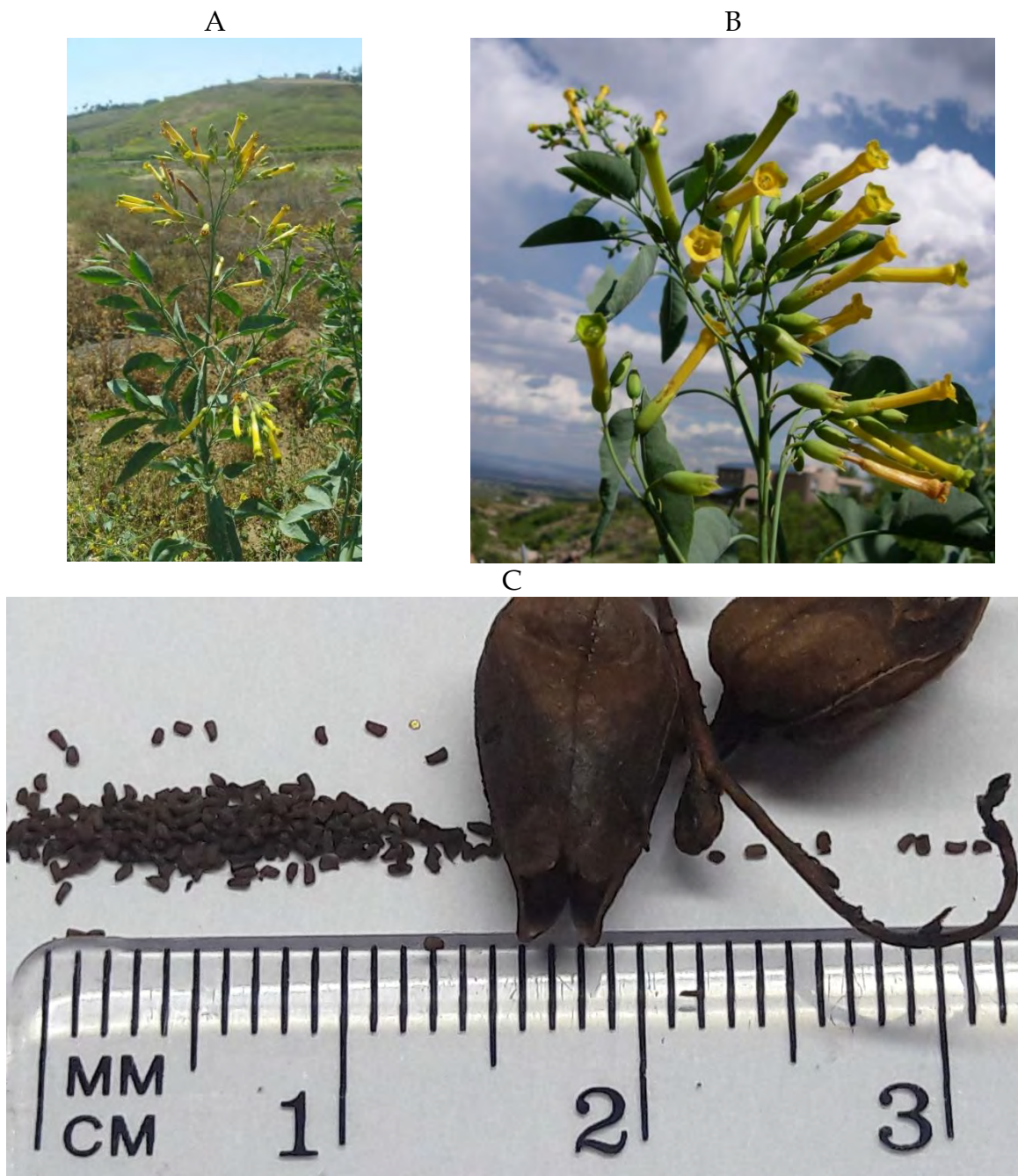
Figura 29.1. A) Nicotiana glauca . B) Flores del tabachín. C) Cápsulas y semillas de N. glauca . Laboratorio de Semillas Forestales, DICIFO, UACH.