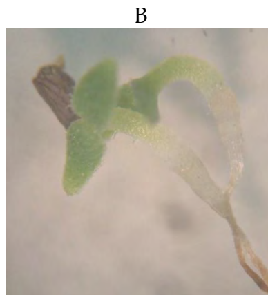
Figura 29.3. A) y B) Plántulas recién germinadas de N. glauca .

Cómo recolectar la semilla. Por el pequeño tamaño de las cápsulas y lo minúsculo de las semillas, se pueden cortar las cápsulas maduras y colocar en bolsas, para luego hacer la extracción en el vivero secándolas. Se recomienda hacer tal actividad en un cuarto, pues debido al pequeño tamaño de las semillas, incluso un viento tenue se las puede llevar. También se puede agitar las cápsulas recién abiertas dentro de bolsas de plástico, para recolectar la semilla.