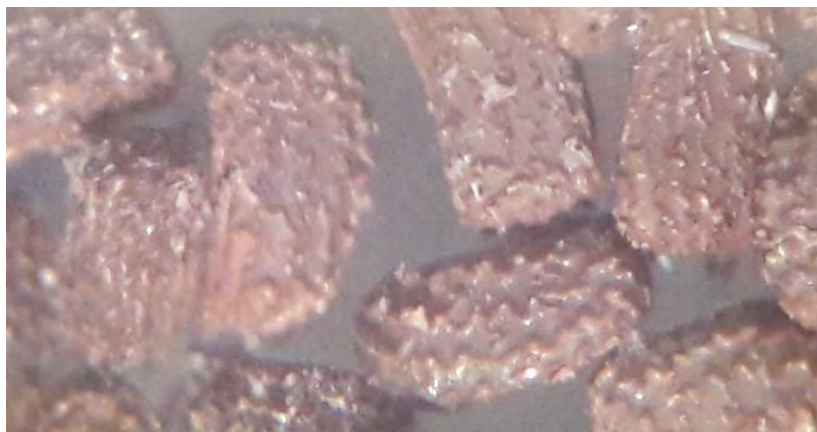
Figura 29.2. Detalle de las semillas de la especie.

Contenido de humedad. Fue calculado un 12.7% de contenido de humedad, base en verde, y 14.5%, base en seco.