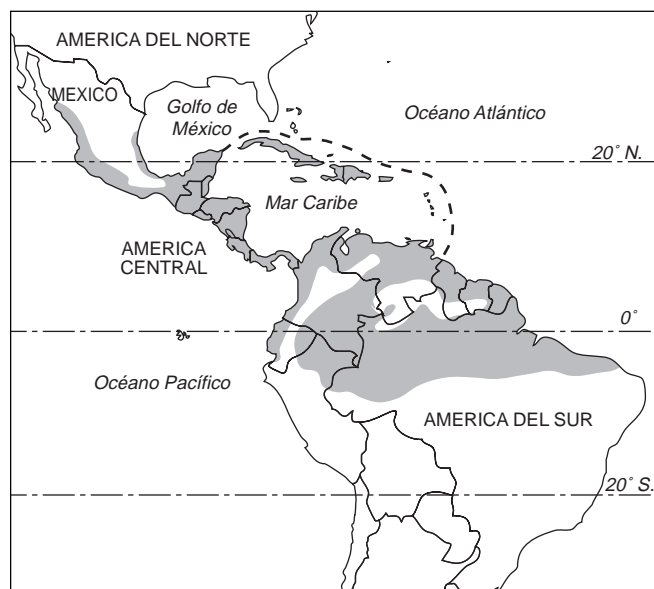
Figura 2.—Area de distribución natural y naturalizada del jobo, Spondias mombin , en la América Tropical. Las líneas punteadas indican el límite exterior de esa área.

El jobo crece tanto en sitios elevados como bajos, y en una gran variedad de suelos. Los órdenes de suelo en los que crece aparentemente más importantes son los Oxisoles, Ultisoles e Inceptisoles. El pH del suelo puede variar desde tan bajo como 5.0 hasta arriba de 7.0. La especie también tolera suelos que tienen una concentración moderadamente baja de nutrientes y que son hasta cierto punto compactos. La especie