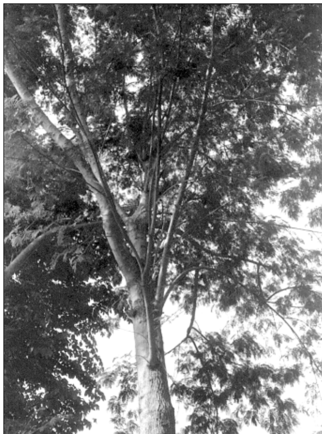
Figura 1.— Leucaena, Leucaena leucocephala , del tipo “gigante” K8 en Puerto Rico.

La leucaena existió originalmente en las tierras medias de Guatemala, Honduras, El Salvador y el sur de México, en